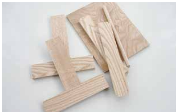
これらを組み合わせてつくります

釘など金属を使わずに木を組み合わせ、家の中で持ち運びができる手提げ盆を作ります。一輪挿しや置き物を飾ったり、インテリアとしてもお使いいただけます。ちょっとそこまで荷物を運ぶのにぴったりなお盆です。