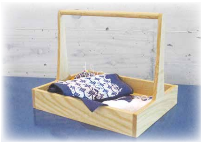
制作サイズ：幅 26×奥行き 20×高さ 21 cm