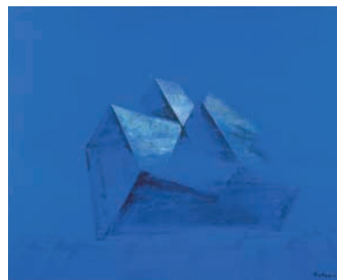
《教会》1976年、油彩・カンヴァス