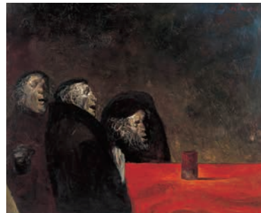
《サイコロ》1969年、油彩・カンヴァス