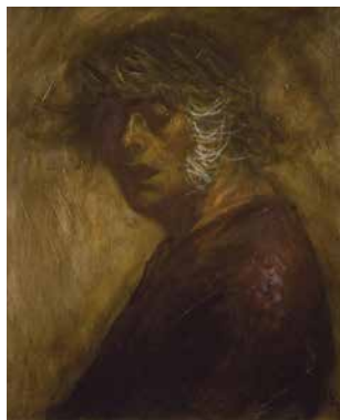
《自画像》1982年、油彩・カンヴァス