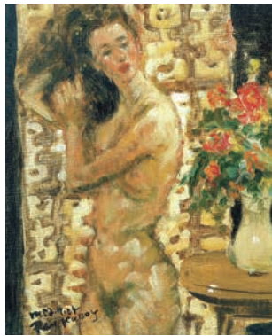
《裸婦立像》1952年、油彩・カンヴァス