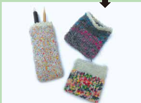
イメージ ※前回制作した作品

身の回りのものを活用して作っ た織り機で、古い布が大変身。 コースターで練習したあとは、 小さなバッグにチャレンジ。 布の様々な色合いがおもしろい 反応をおこし、不思議でなんと も味わい深い表情が生まれます。