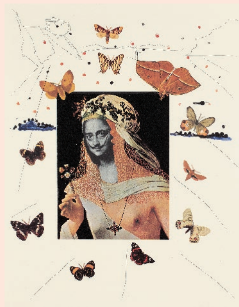
サルバドール・ダリ 「蝶に囲まれたダリのシュルレアリスムの肖像」 『シュルレアリスムの思い出』より 1971年 フォトリトグラフ、エッチング