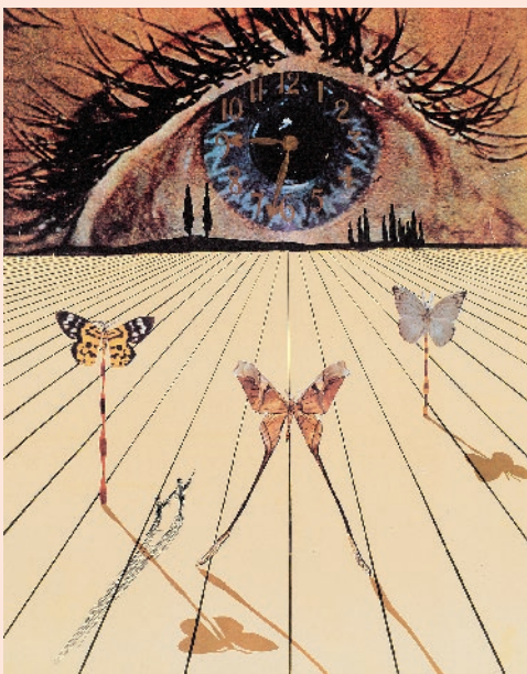
サルバドール・ダリ 「シュルレアリスムの時間の日」 『シュルレアリスムの思い出』より 1971年 フォトリトグラフ、エッチング