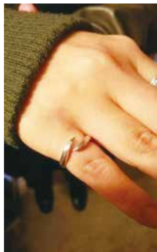
③オリジナルデザインリングの完成です！

[講師] 黒澤由希氏 (HAYASE 主宰) [日時] 全3回 10月15日(日) 10:00~12:00 (2時間) 11月3日(金・祝) 10:00~13:00 (3時間) 12月3日(日) 10:00~11:30 (1時間30分) [費用] 3,500円 [持物] 汚れてもよい格好、手ふきタオル [受付] 9月5日(火)~10月3日(火) ※休館日を除く