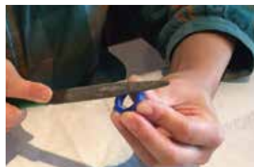
①ワックスで原型を作ります

ワックスを使って成型するオリジナルリング。 はじめにフィールドワークを行い、題材を探し、 デザイン技法を学びます。 思いをデザインに込め、感性を自由に開放して 楽しみましょう！