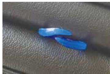
②ワックスの原型が完成 その後、鑄造は専門の工場で行います