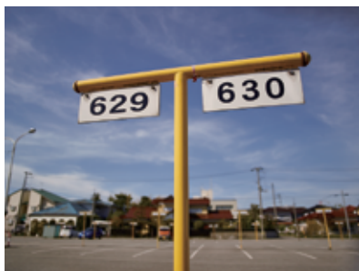
Tsuruoka #1, 2015