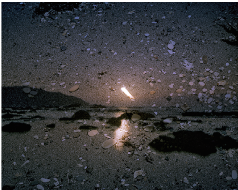
Yura #1, 2013