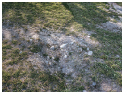
The Ground #2, 2015