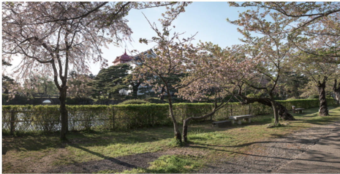
Tsuruoka Park #1, 2015