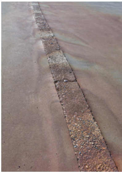
Tsuruoka #7, 2015