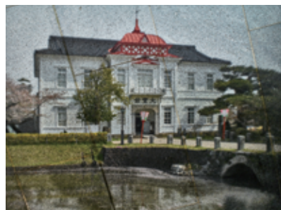
Tsuruoka #3, 2015