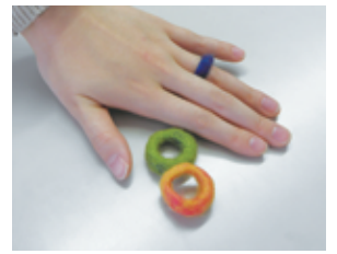
素材を知るために指輪もつくります